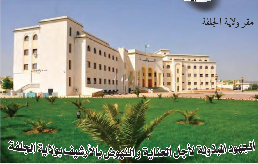
مقر ولاية الجلفة