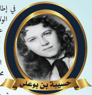
حسيبة بن بوعلي

في إطار سلسلة الندوات و الملتقيات التي ينظمها المجلس الشعبي الولائي لولاية الجزائر، تلقى المدير العام للأرشيف الوطني، السيد عبد المجيد شيخي، دعوة للمشاركة في مجريات المحاضرة التي أقيمت بتاريخ 08 أكتوبر 2014، وذلك إحياء للذكرى الـ 57 لاستشهاد البطلة حسيبة بن بوعلي، بالثانوية التي حملت اسم الشهيدة بالقبة، وبهذه المناسبة قدم السيد عبد المجيد شيخي، محاضرة تاريخية حول حياة هذه البطلة التي ضحت بنفسها من أجل الجزائر حيث أشاد بمخصال البطلة كما أبرز شجاعتها و مقومتها البطولية لقوات الاحتلال الفرنسي.