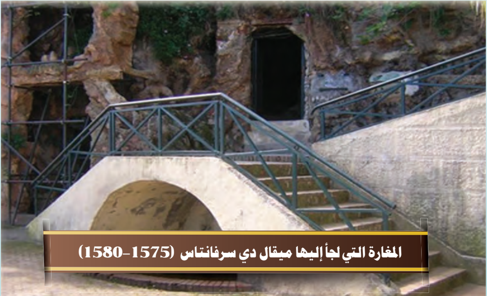
المغارة التي لجأ إليها ميغال دي سرفانتس (1575-1580)

توفي في 23 سبتمبر 1616م مات فقيراً معدماً ولم يتذوق طعم الشهرة التي نالها بعدئذ. وفي العالم اليوم أكثر من 2350 طبعة من رواية "دون كيشوت" في 78 لغة عالمية.