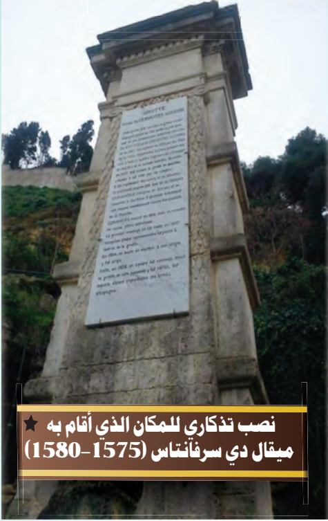
★ نصب تذكاري للمكان الذي أقام به ميقال دي سرفانتس (1575-1580)

إلا بعد أن قضى خمس سنوات في الأسر (1575- 1580).