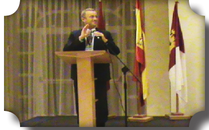
الإفتتاح الرسمي للندوة الدولية للمائدة المستديرة للأرشيف

«مشهد حول حفظ الأرشيف في القرن 21 : الظروف، التحديات و المشاكل».