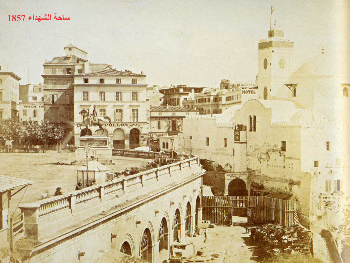
ساحة الشهداء 1857