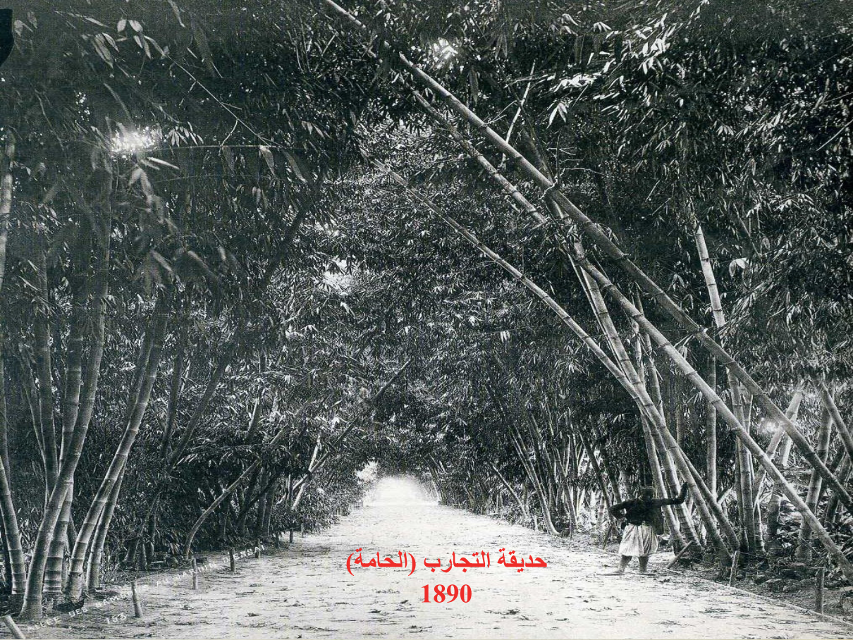
حديقة التجارب (الحامة) 1890