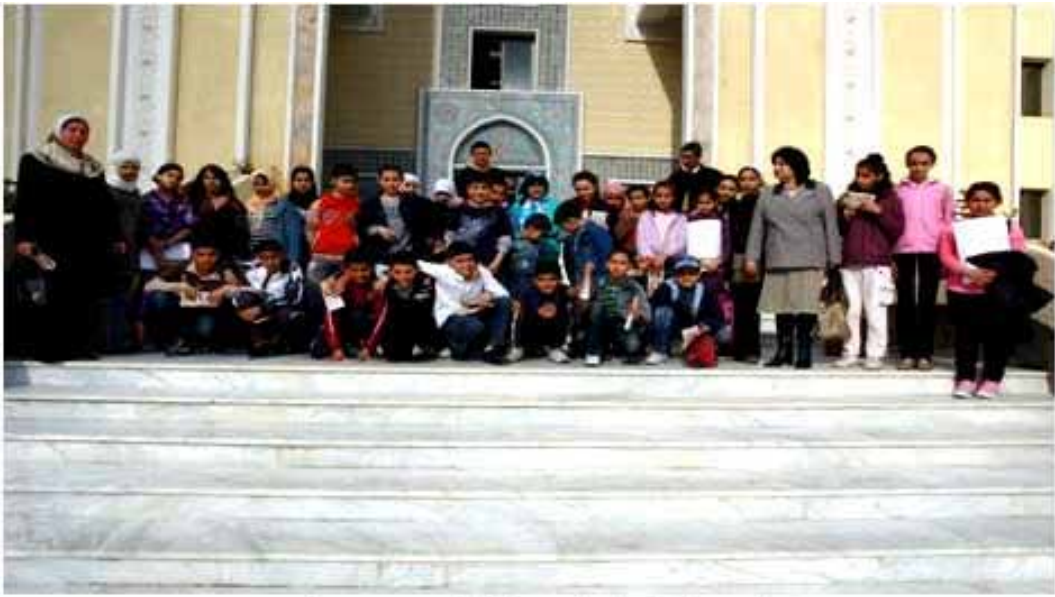
زيارة تلاميذ متوسطة فريد مغراوي