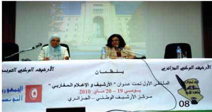
الملتقى الأول التونسي تحت عنوان " الأرشيف و الإعلام المغربي " 19 2010 ماي 20 و .

في هذا الصدد تمت رقمنة كل التسجيلات الخاصة بهذه السنة ، كذلك رقمنة كل الأشرطة السمعية البصرية من نوع VHS و Mini DV و الموجود بالرصيد القديم