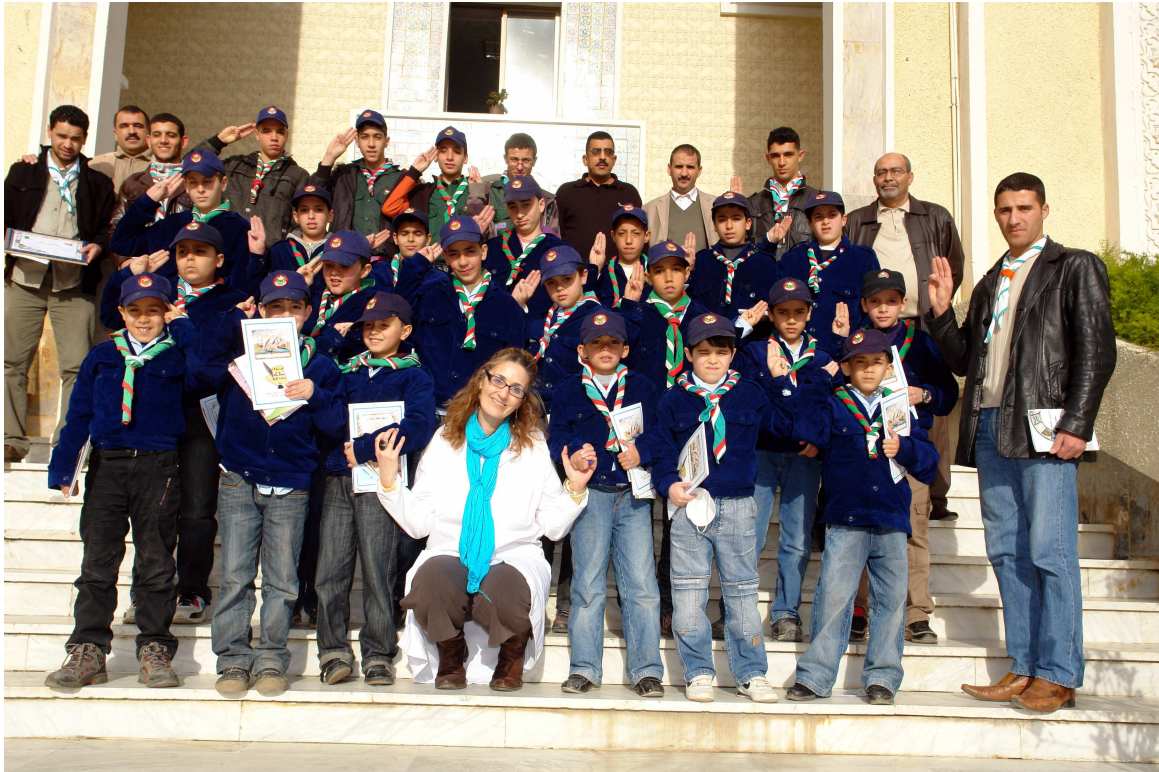
الزيارات التابعة لنشاط التثمين والتطوير