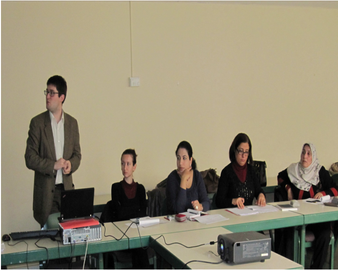
قاعة الدرس بأرشيف ما وراء البحار AIXE PROVANCE