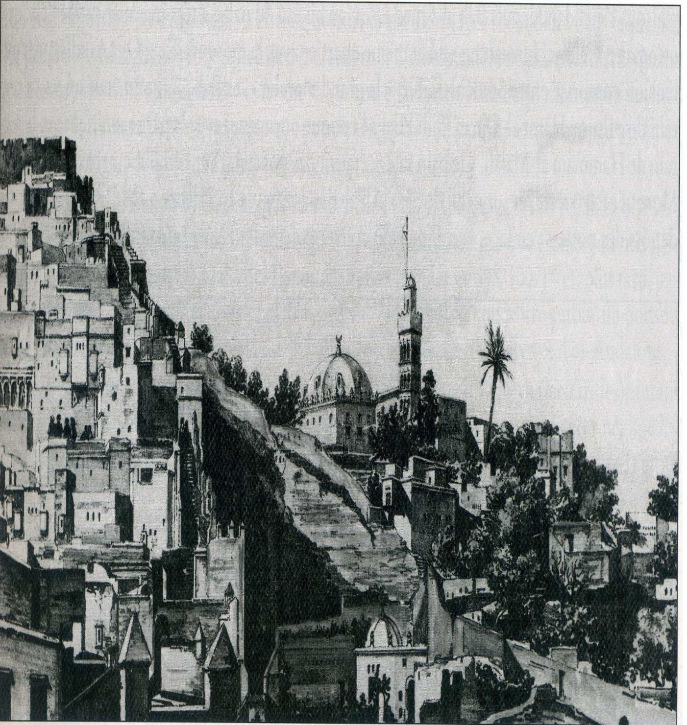
باب الواد ( ضريح سيدي عبد الرحمان الثعالبي