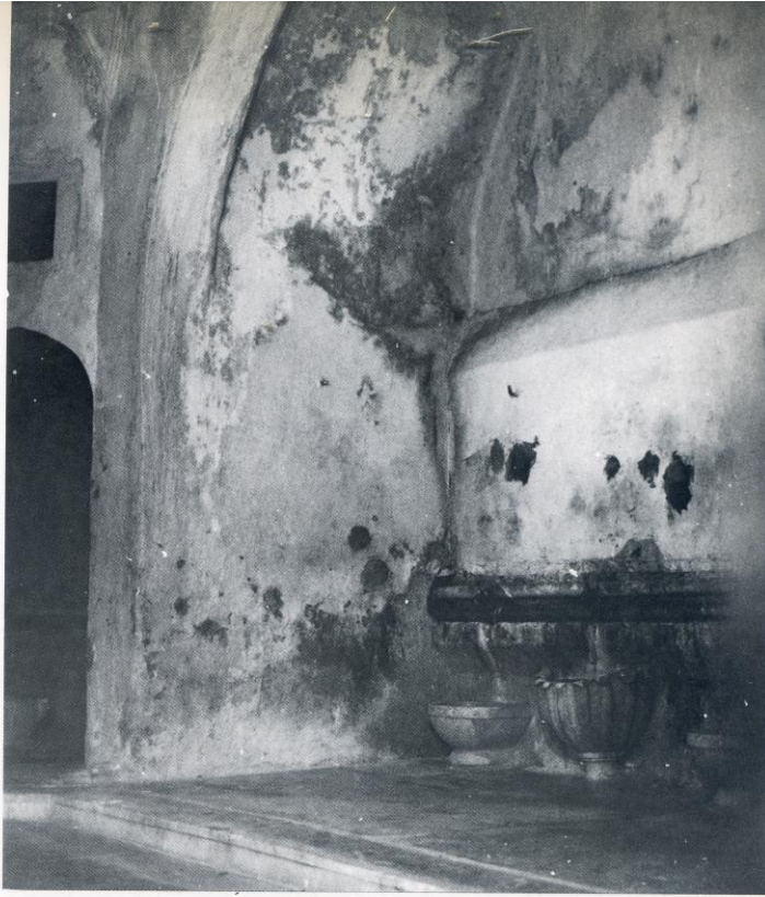
حمام من أقدم الحمامات بالجزائر : حمام سيدنا