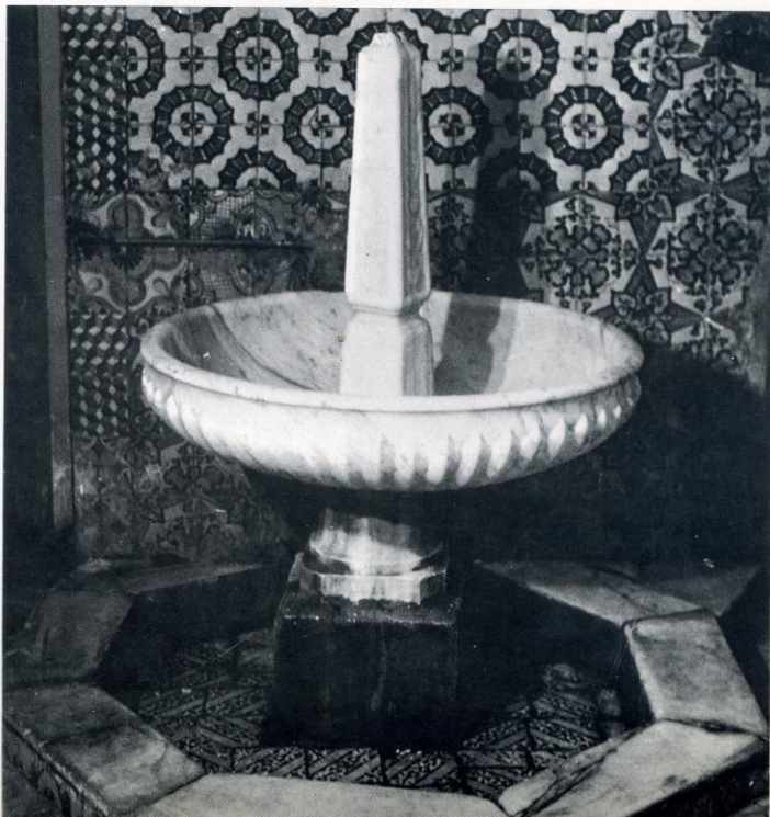
صحن حمام سيدنا