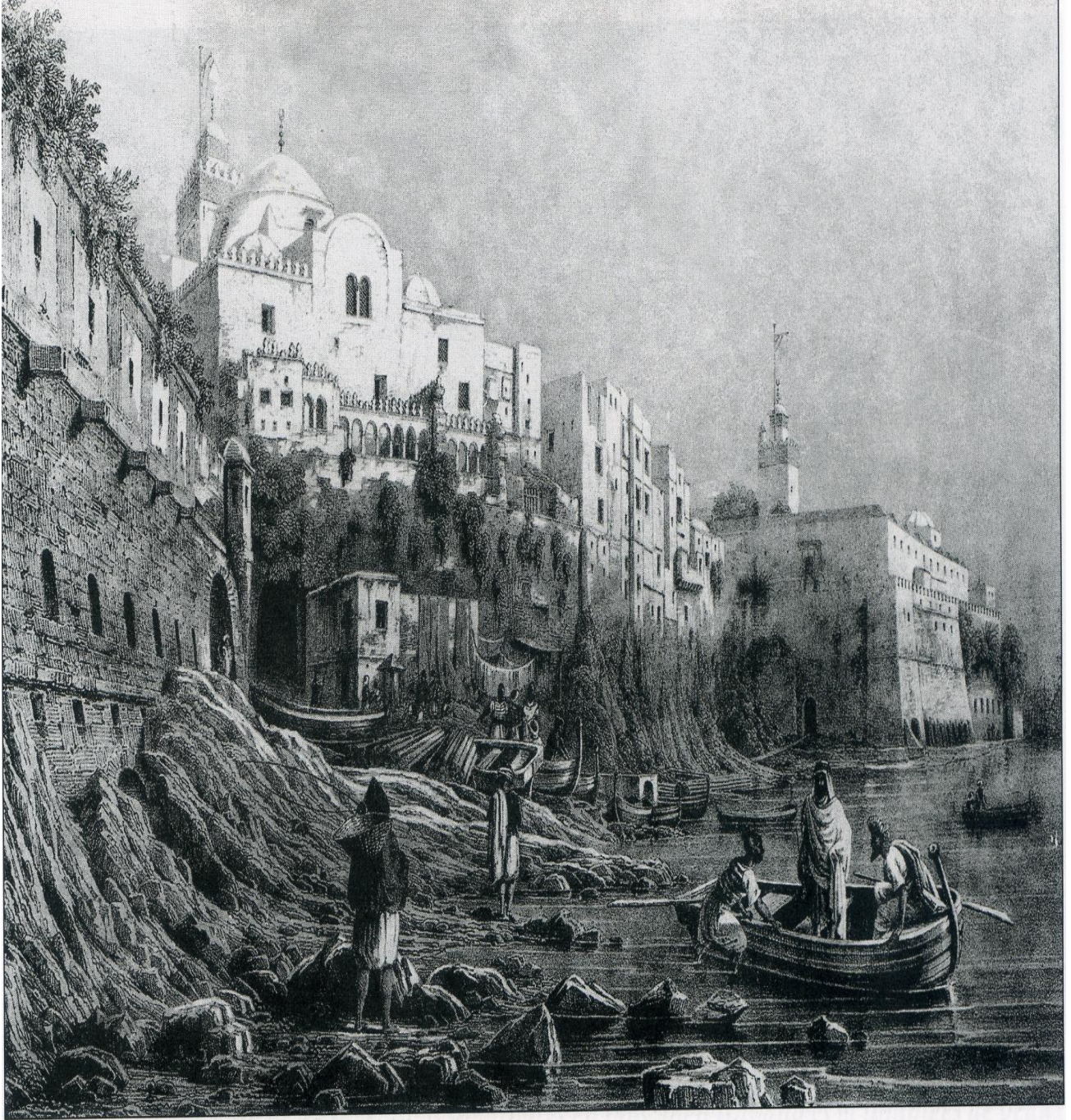
نظرة لباب البحر من أعلى الجامع الجديد وعلى اليمين الجامع الأعظم